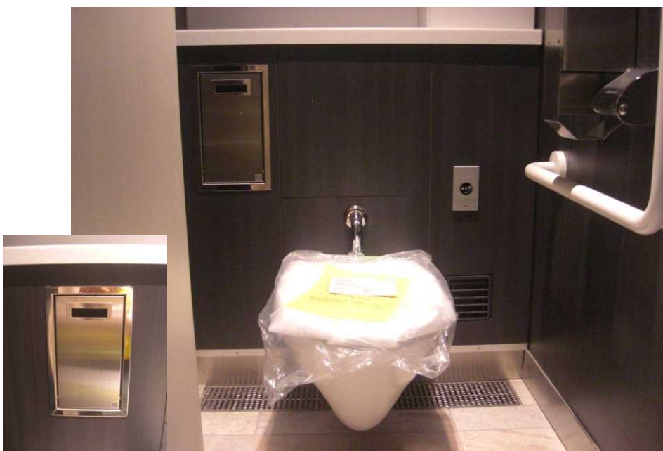
チャームボックス